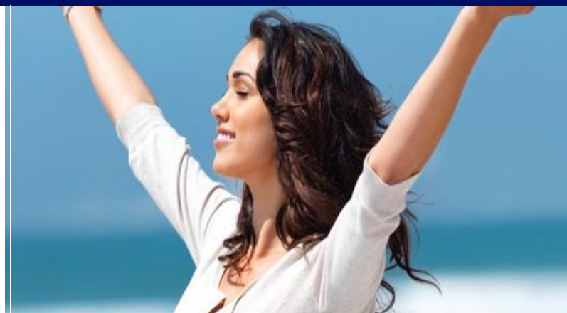
МОЈОТ ПАТ КОН УСПЕХОТ