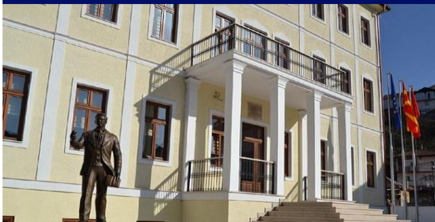
УНИВЕРЗИТЕТ „ГОЦЕ ДЕЛЧЕВ“ ШТИП